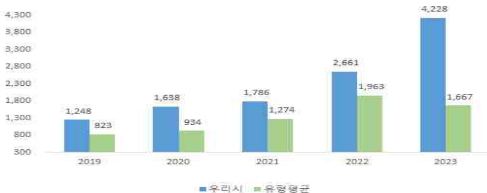
최근 5년 기금 운용현황

우리시는 통합재정안정화 기금을 포함하여 총 12개의 기금을 운영중이며, 2023년 기금결산 보고서상의 기금 현재액은 4,228억입니다.