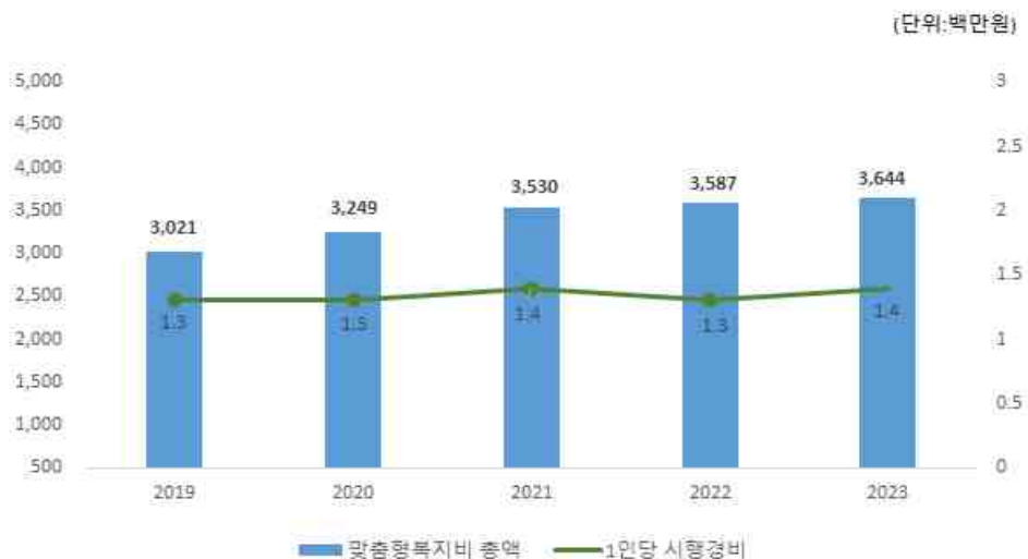
최근 5년 맞춤형복지비 현황