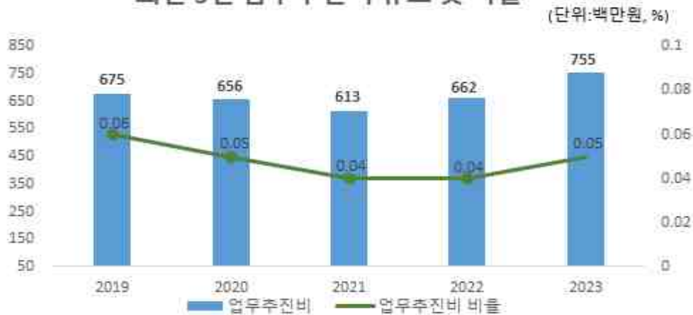
최근 5년 업무추진비 규모 및 비율