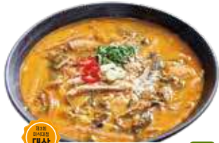
짱뽕어탕 4인 / 40,000원

직접 담은 된장과 깨끗하게 손질한 내장으로 국물을 내 구수하고 깊은 맛의 짱뽕어탕