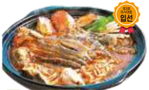
민물매운탕 4인 / 50,000원

바로 잡은 신선한 민물생선과 순천 특산물 참깨, 제철재료를 만들어 기운을 북돋아주는 보양식