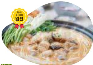
아구탕 4인 / 49,000원

영양가 높은 도통함 아구살과 25년 노하우가 담긴 들깨 양념이 더해진 진한 국물 맛이 일품