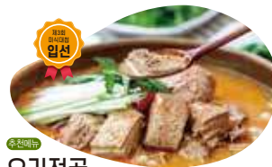
오리전골 4인 / 58,000원

구수한 들깨국물과 2대째 이어온 특별한 양념으로 끓여 단골들의 끊임없는 사랑을 받고 있는 곳