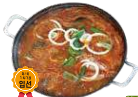
묵은지 고등어찌개 4인 / 32,000원

묵은지 국물과 특제양념으로 숙성시킨 고등어를 뚝 끓여내 깊은 감칠맛이 나는 엄마손맛 가득한 요리를 맛볼수 있는 곳