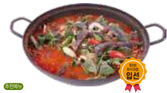
순천만 짱뽕어전골 4인 / 80,000원

갈대밭이 아름다운 순천만 바로 앞. 짱뽕어전골과 전라도의 한상차림을 받아볼 수 있는 곳