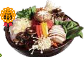
한우버섯전골 4인 / 54,000원 (공기밥 포함)

우리 지역에서 나는 버섯과 야채, 소고기로 만든 웰빙건강식을 맛볼 수 있는 곳