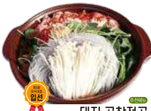
돼지 곱창전골 4인 / 32,000원

화학 조미료 없이 순수 국내산 돼지 내장, 막창과 신선한 야채, 2대째 내려오는 비법육수로 만들어 안심하고 먹을 수 있는 곱창전골