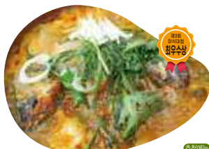
향비물회 1인 / 15,000원 매운탕 1인 / 20,000원

지치고 힘들때 한번 드시면 힘이 불끈 솟아 나는 상성한 물회 푸짐한 양과 인심이 느껴지는 곳