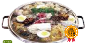
힘불끈어복쟁반 4인 / 80,000원

3년 이상 발효시킨 산야초 효소, 2년 간 발효한 신안 천일염, 우리콩 된장, 간장 등 천연 조미료와 천연 효소를 사용해 요리하는 웰빙맛집